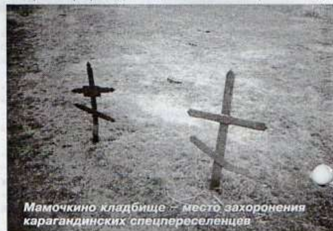
Мамочкино кладбище – место захоронения карагандинских спецпереселенцев

Приговор приведен в исполнение 2 ноября 1937 года.