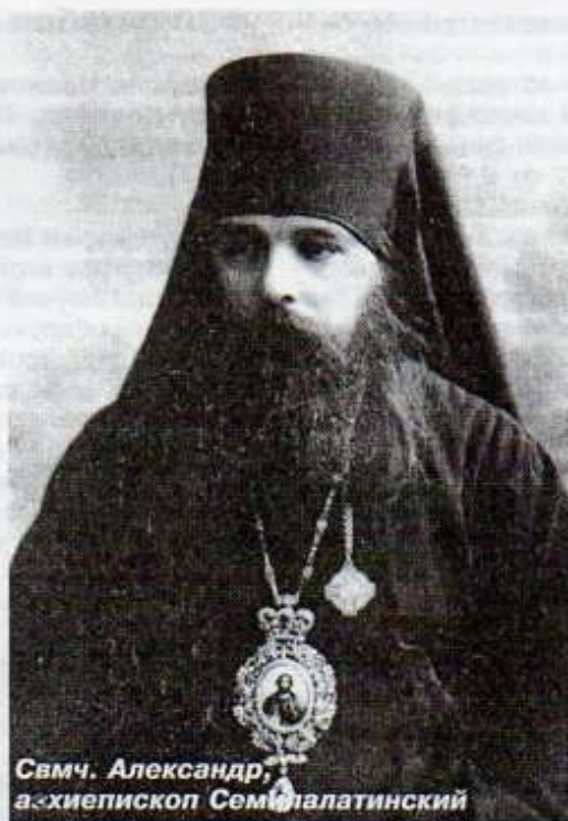
Свмч. Александр, архиепископ Семипалатинский

– Проповеди я говорю каждое воскресенье на темы Священного Писания... и иногда в защиту религиозных истин, оспариваемых современниками. Произнесение проповедей и выступление в защиту истины вызывалось стремлением найти истину в вопросах, сопряженных с религией, в которых я предоставлял доказательства учения православно-христианского по этим