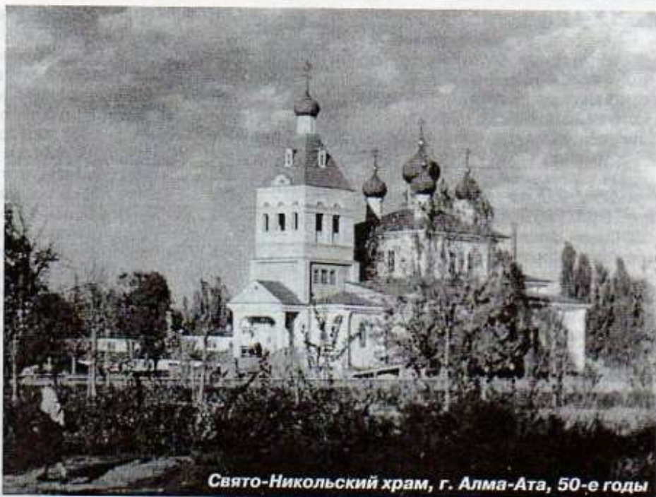
Свято-Никольский храм, г. Алма-Ата, 50-е годы

В 1946 году общине верующих передана Никольская