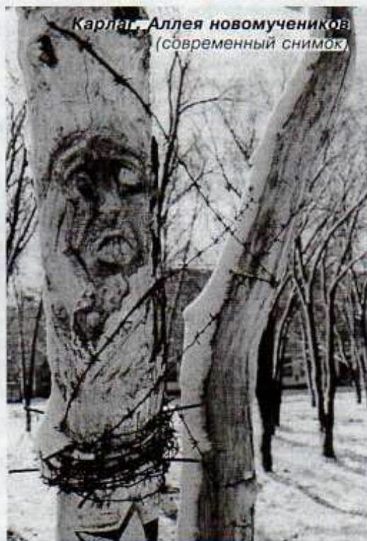
Карлаг. Аллея новомучеников (современный снимок)

В 1897 году окончил Тамбовскую Духовную семинарию. Священнический сан принял в 1903 году.