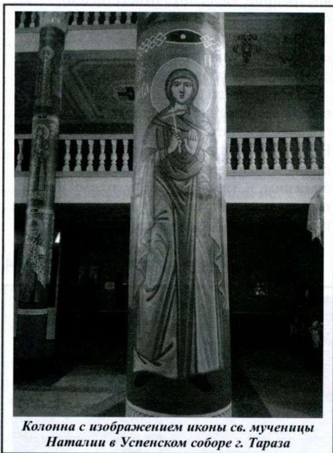
Колонна с изображением иконы св. мученицы Наталии в Успенском соборе г. Тараза

Материалы к жизнеописанию святой мученицы Наталии Сиваковой и пострадавшего с ней церковного старосты Константина Конькова