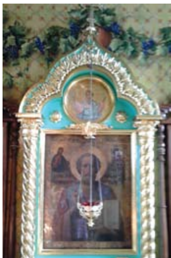
Икона Святителя Николая Мирликийского, написанная в память 25-летия битвы уральских казаков под Иканом