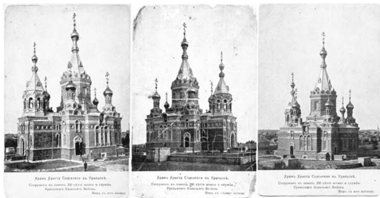
Почтовые открытки 1912- 1915 г.г.