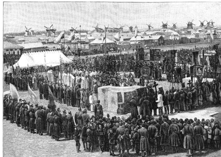
300 лѣтній юбилей Уральскаго казачьяго войска. Закладна новаго храма.