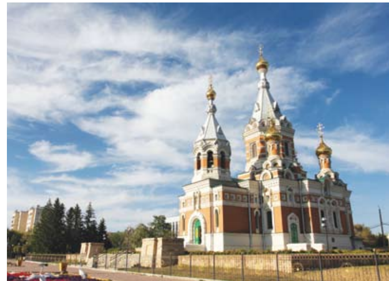
Храм Христа Спасителя.