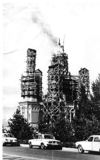
Пожар во время реставрационных работ в 1987 году.