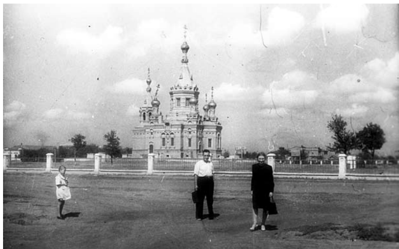
Вид с южной стороны храма в 50-е годы XX века.