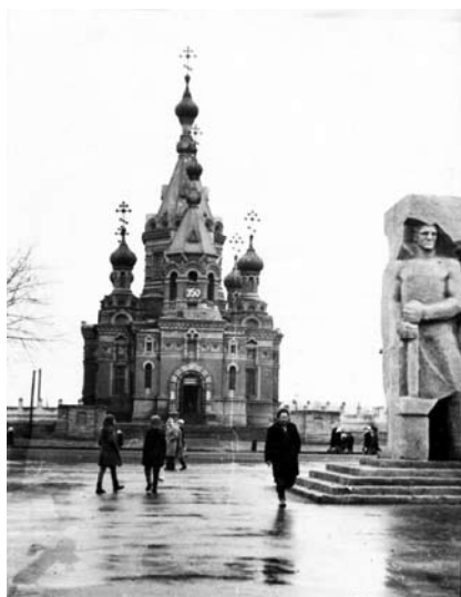
70-е годы XX века.