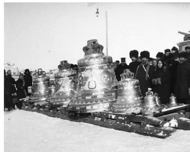
Освящение колоколов 4 ноября 1907 года.