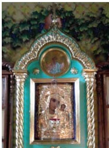
Табынская икона Божьей Матери.