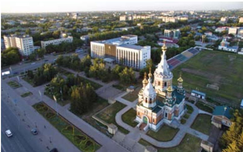
Храм Христа Спасителя.