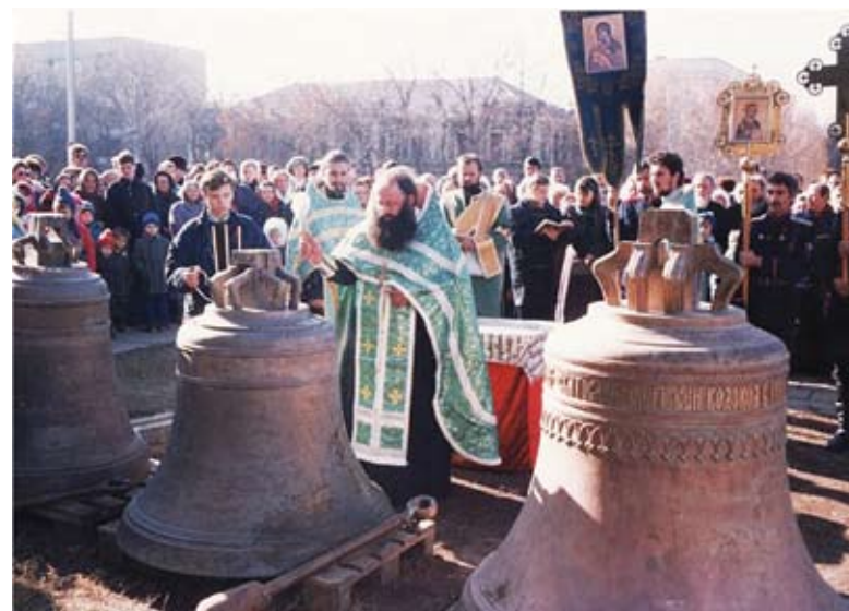
Освящение колоколов в октябре 1995 года.